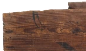
こうかさねんべざいせんいたず 弘化三年弁財船板図 (部分・重要有形民俗文化財「瀬戸内海の船図及び船大工用具」)

大陸と畿内を結ぶ大動脈であった瀬戸内海は、和船の故郷(ふるさと)でもあります。「船大工用具」は、海運を支えた職人の技を今に伝えています。また瀬戸内の各地で活躍した負子などの背負運搬具には、大陸文化とわが国の在来文化が融合した跡を見ることができます。島に山にこれらを追って始まった旅での発見を語り尽くしていただきます。