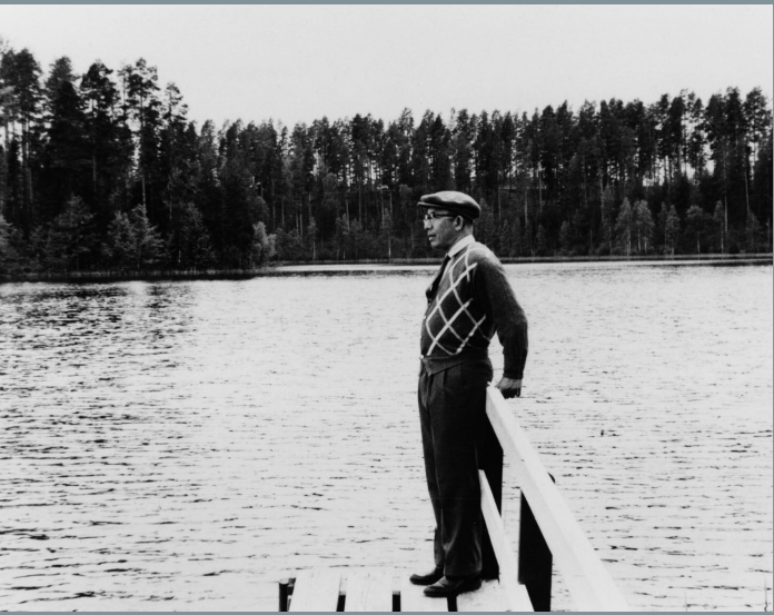
東山魁夷 フィンランドにて 1962年撮影