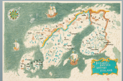
東山魁夷「北欧紀行 古き町にて」より「地図」リトグラフ