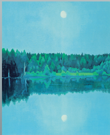
東山魁夷「二つの月」リトグラフ