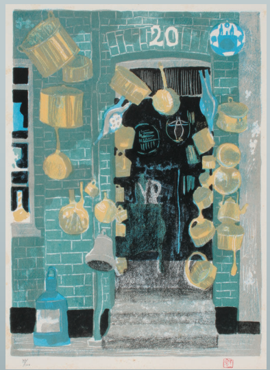
東山魁夷「北欧紀行 古き町にて」より「オーデンセの古道具屋」リトグラフ