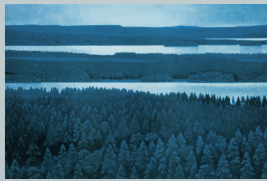
東山魁夷「白夜光」複製画

本展では、当館所蔵の東山魁夷作品と、今年開館50周年を迎える香川県立瀬戸内海歴史民俗資料館が所蔵するJETRO(日本貿易振興会・当時)収集海外優秀商品から選んだ北欧デザイン製品、あわせて80点を超える作品・資料を通し、魁夷が旅を通して見つめた北欧の風景や暮らしを探るとともに、当時の暮らしに根ざした北欧デザインを紹介します。