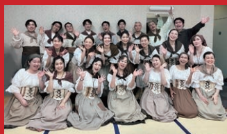
メサイヤ (ヘンデル) より 『ハレルヤ』 四国二期会オペラ合唱団