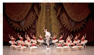
バレエ 島田バレエ団 バレエ「白鳥の湖」よりワルツ (チャイコフスキー)