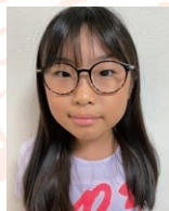
童謡 江郷衣千花 スキーの歌 (橋本国彦)