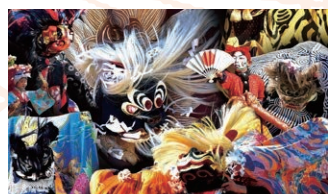
獅子舞演舞 讃岐獅子舞保存会