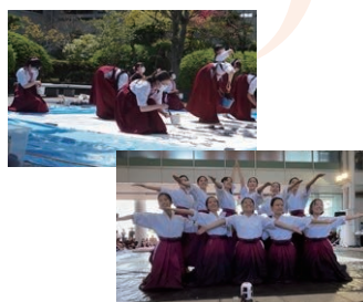
書道パフォーマンス 香川県立高松北高等学校 & 香川県立高松桜井高等学校 【コラボレーションBGM】 木星 (ホルスト)