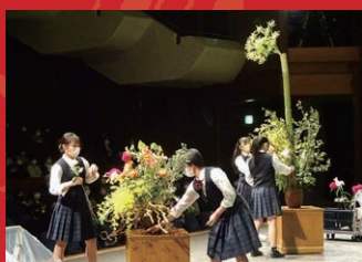
フラワーアレンジメント 香川県立飯山高等学校