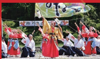
よさこい踊り さめき舞人 演舞「正調よさこい節」&「源平花語り」